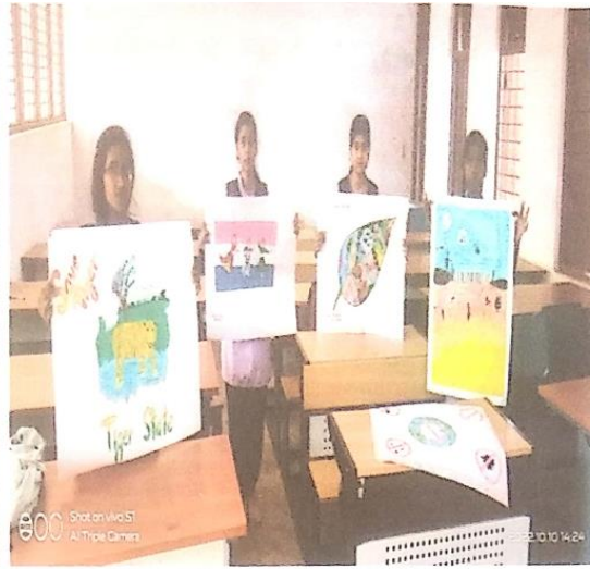
स्पोर्ट पेंटिंग एवं पोस्टर प्रतियोगिता